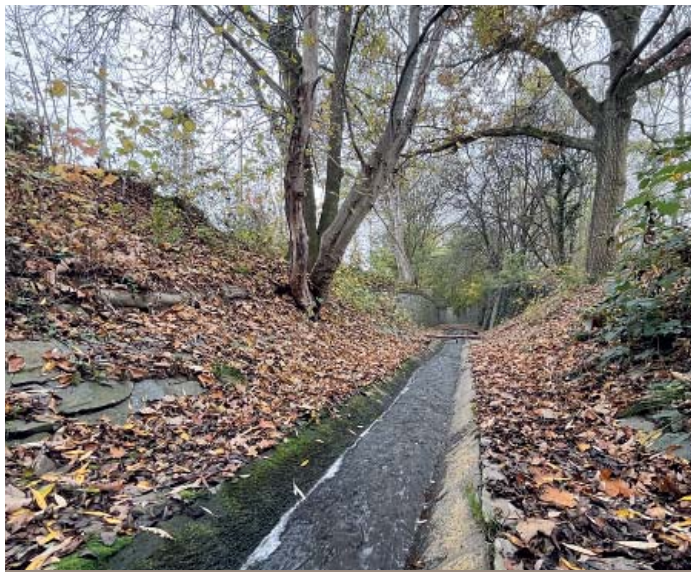
Část Kunratického potoka před revitalizací.