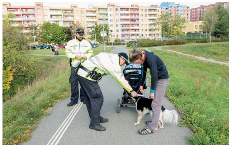
Strážníci nemohou být všude, důležitá je proto obyčejná lidská ohleduplnost.