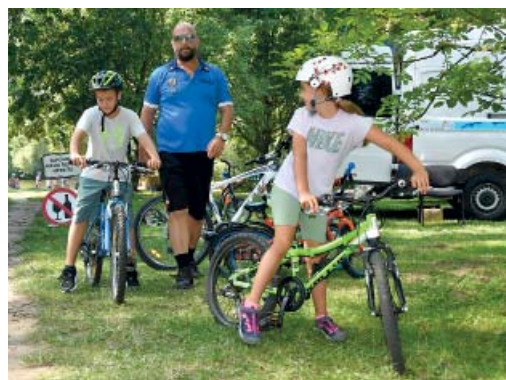
Preventivní akce měla za cíl snížit počet odcizených kol v městské části i přispět k bezpečnějšímu cyklistickému prostředí.

skou policií. Kromě toho mohli návštěvníci vyzkoušet širokou škálu doprovodných aktivit. Připraveny byly půjčovny kol, koloběžek a kolečkových bruslí. Pro nejmenší účastníky i dospělé byla připravena jízda zručnosti, kde si mohli otestovat své dovednosti a získat cenné zkušenosti pro bezpečné ovládání svého dopravního prostředku. Pokud jste se